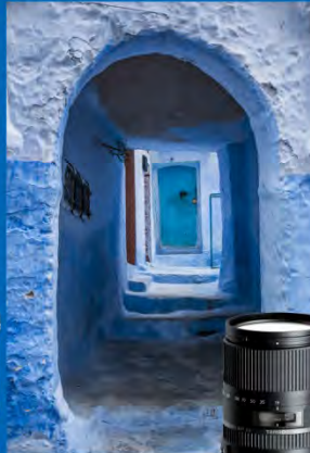
16-300mm F/3.5-6.3 Di II VC PZD