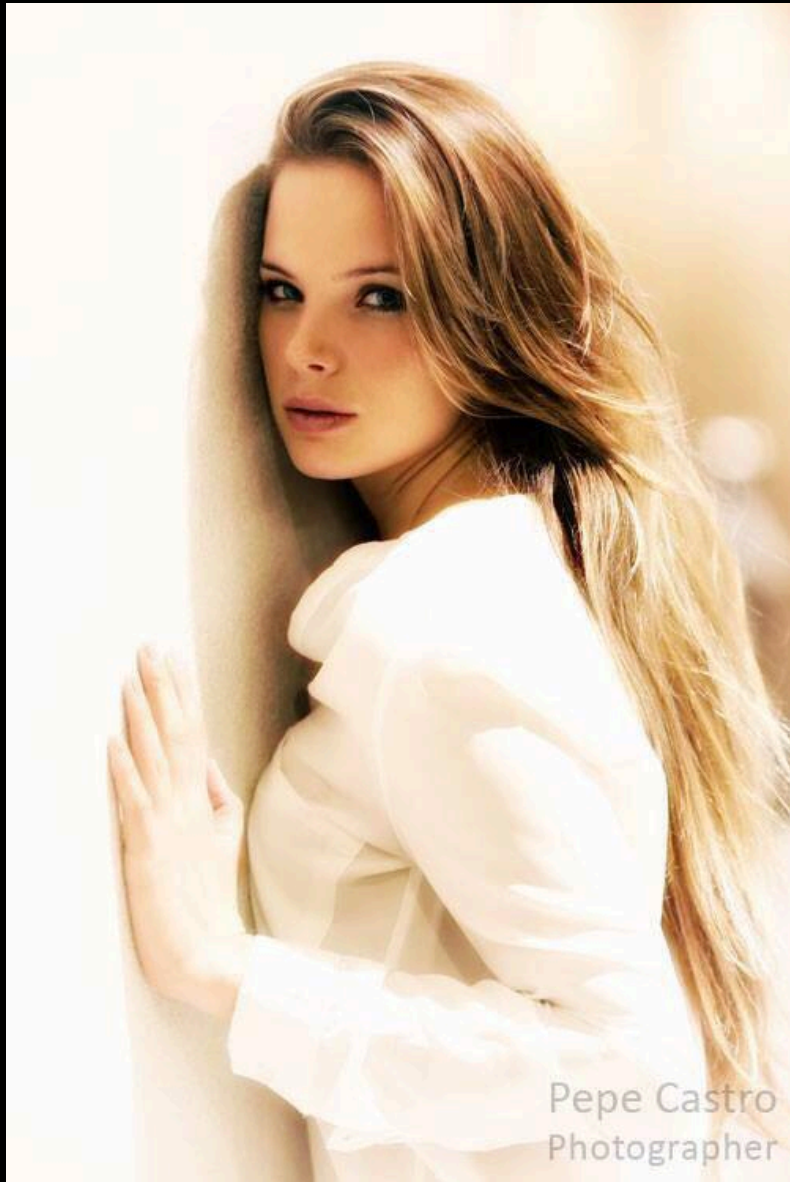
Pepe Castro Photographer